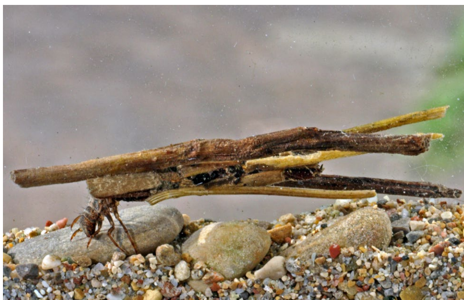
Figure 3 : larve de Phrygane.