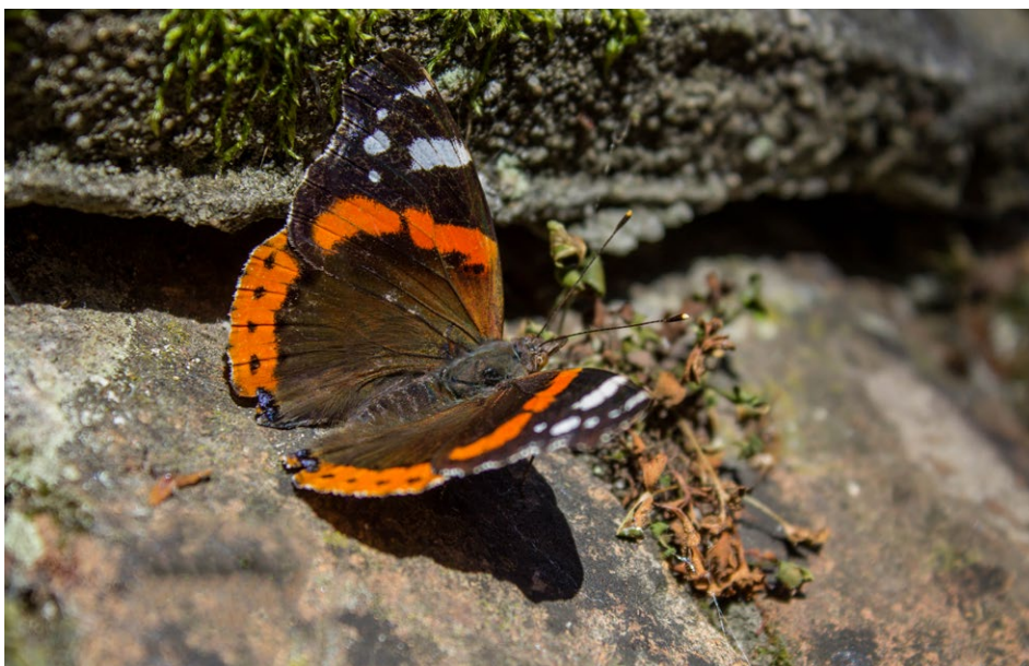
Figure 22 : papillon.