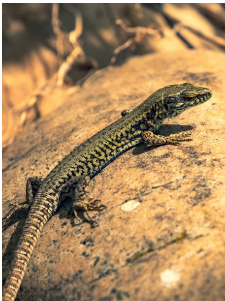
Figure 33 : lézard.