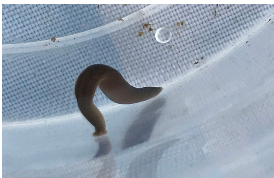
Figure 25 : sangsue.