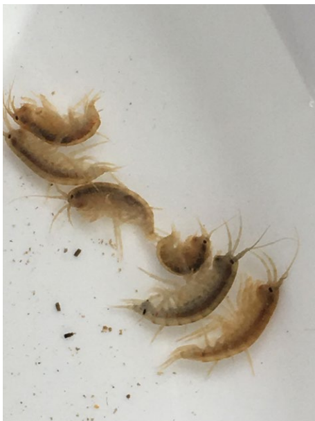
Figure 30 : gammares.