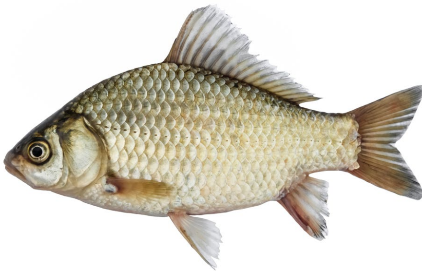
Figure 29 : carpe - poisson des rivières.