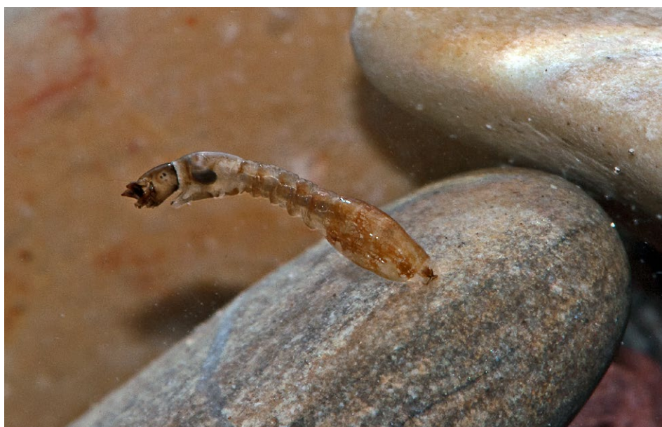
Figure 15 : larve de Simulie.