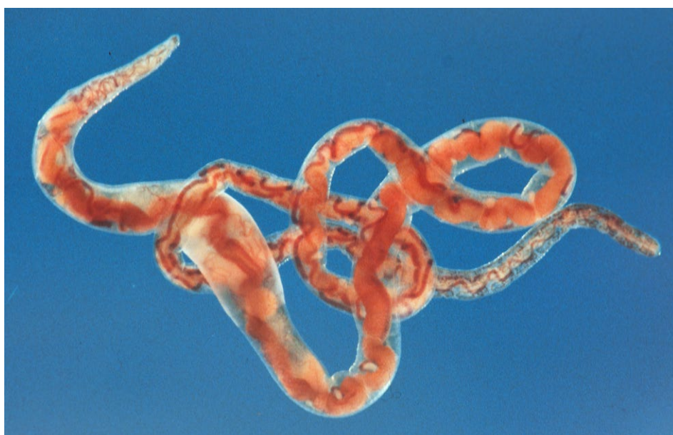
Figure 19 : ver de vase (Tubifex).