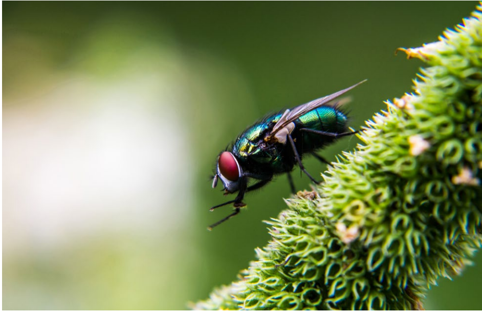
Figure 32 : mouche.