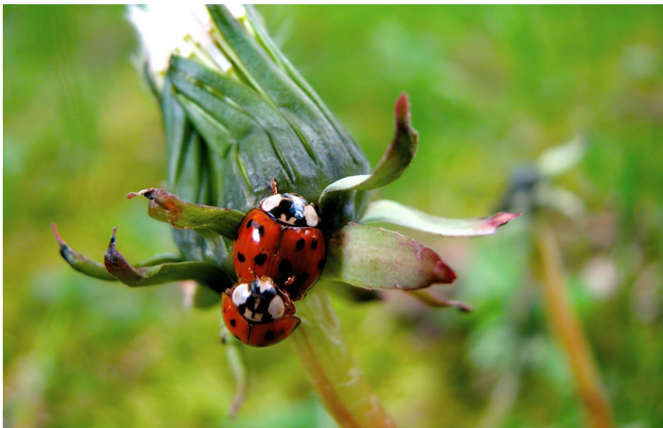
Figure 27 : coccinelle.