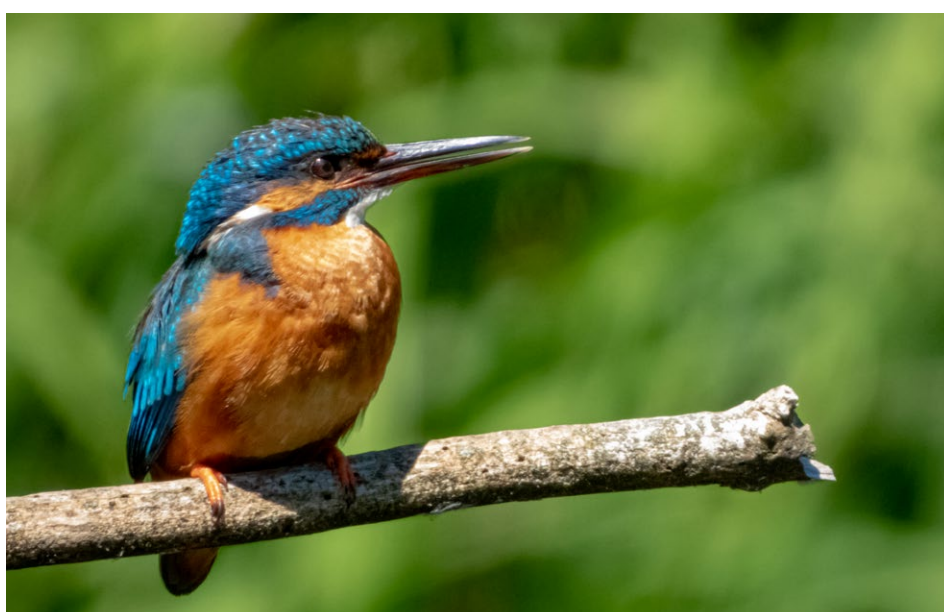
Figure 16 : martin-pêcheur.