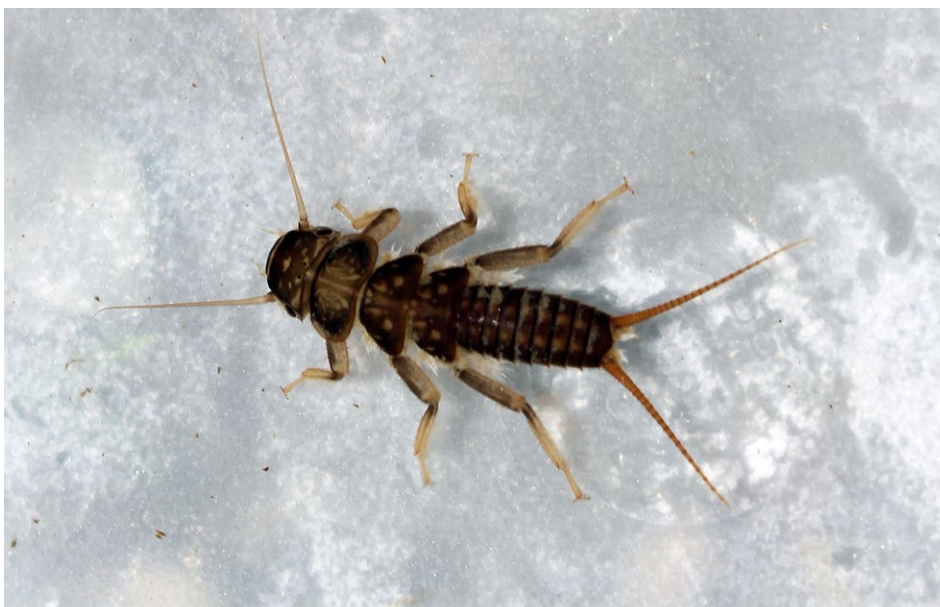
Figure 31 : larve de Perle.