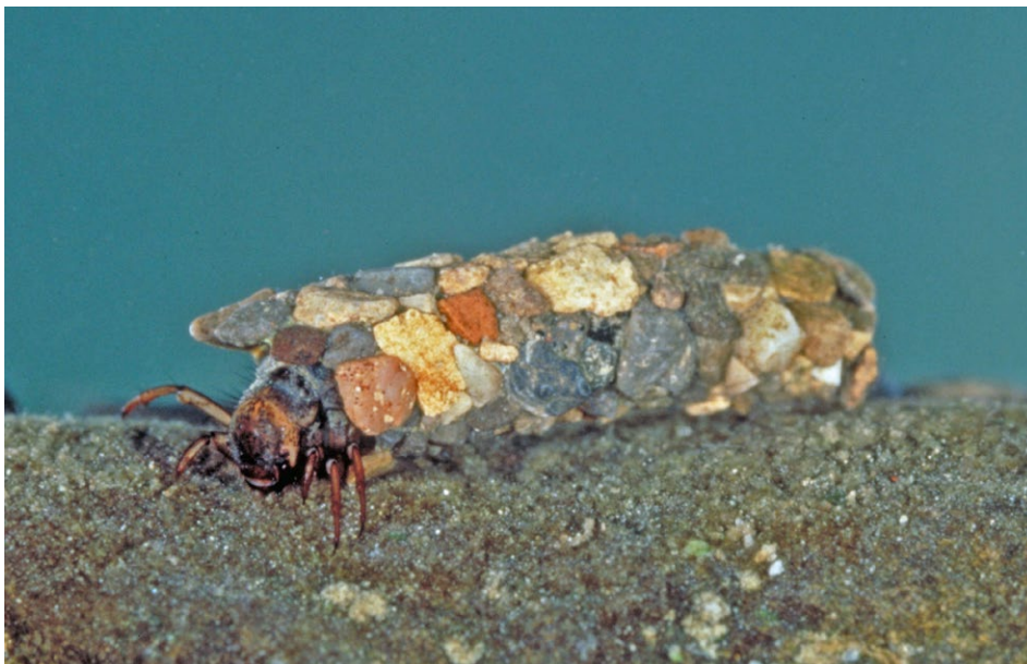
Figure 9 : larve de Phrygane.