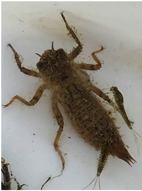
Figure 11 : larve de libellule.