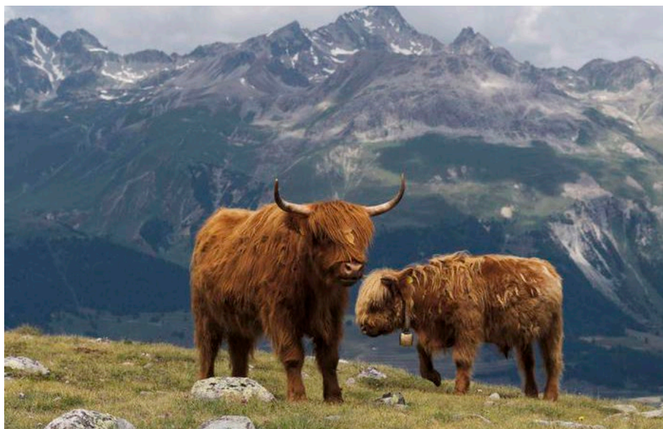
Figure 14 : bovins des Highlands écossais.