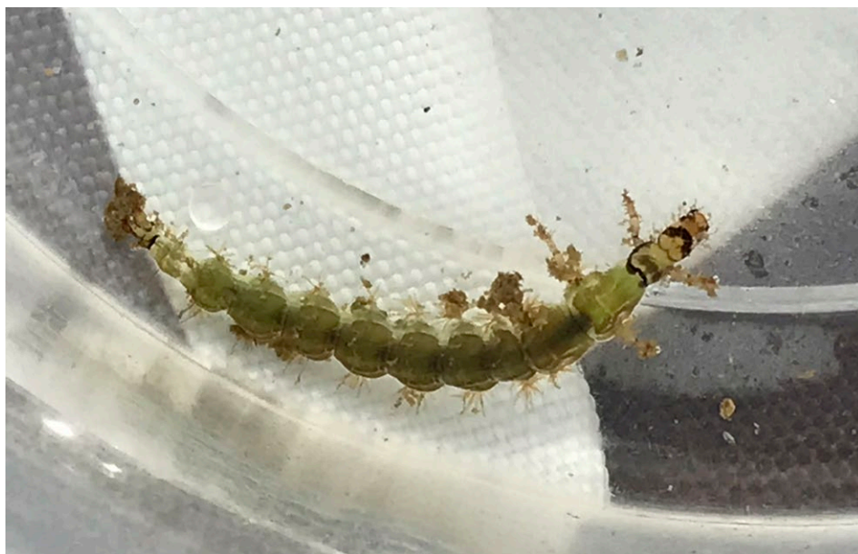
Figure 5 : larve de Phrygane sans fourreau.