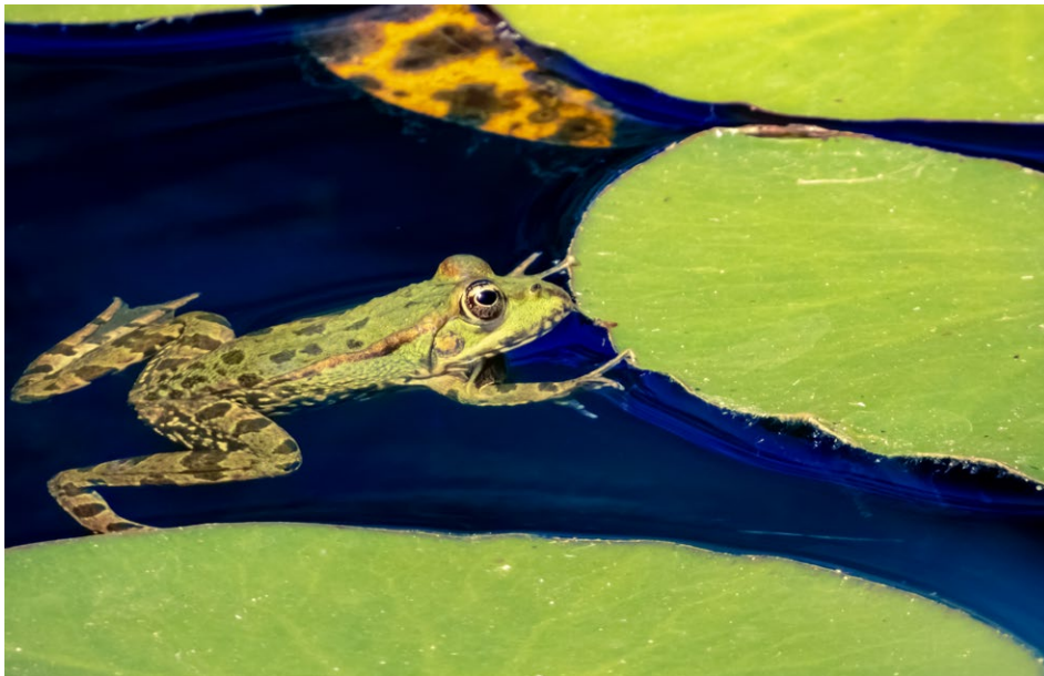
Figure 20 : grenouille.