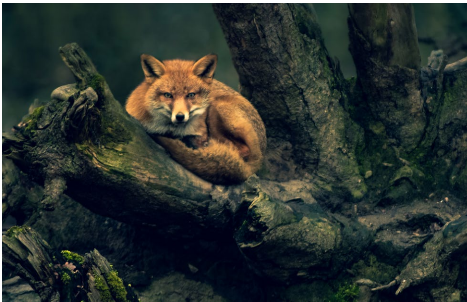
Figure 12 : renard.