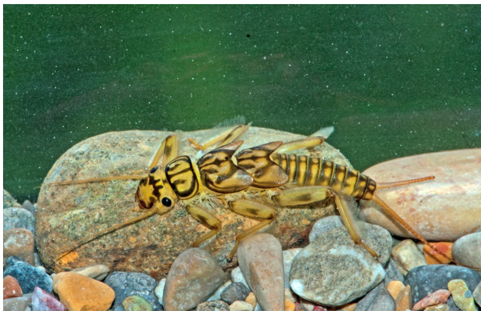
Figure 23 : larve de Perle.