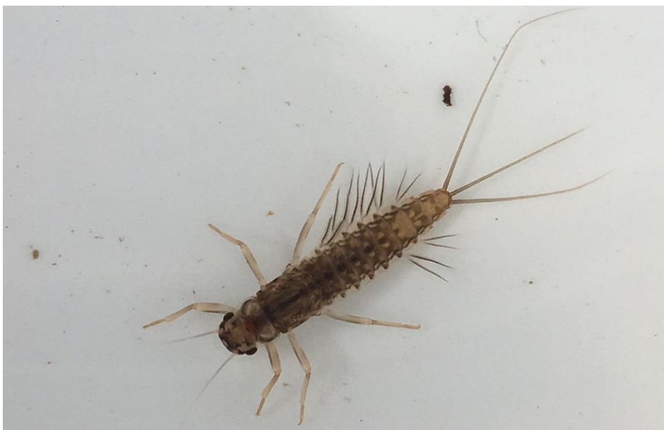
Figure 13 : larve d'Éphémère.