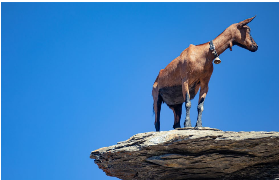
Figure 10 : chèvre.