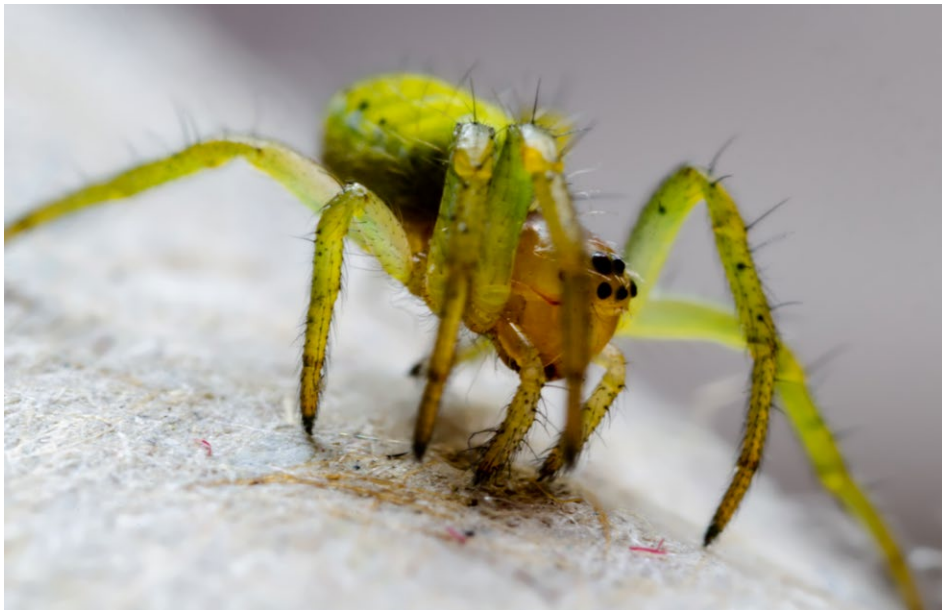
Figure 26 : araignée.