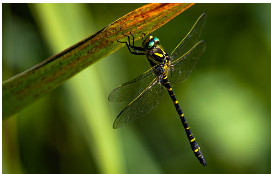
Figure 6 : libellule.