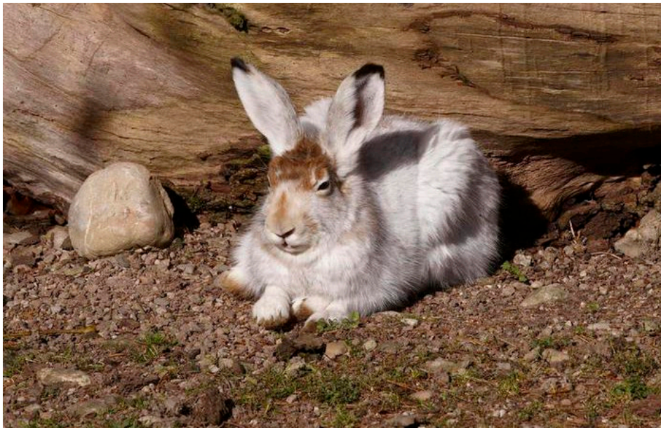
Figure 8 : Lièvre variable.