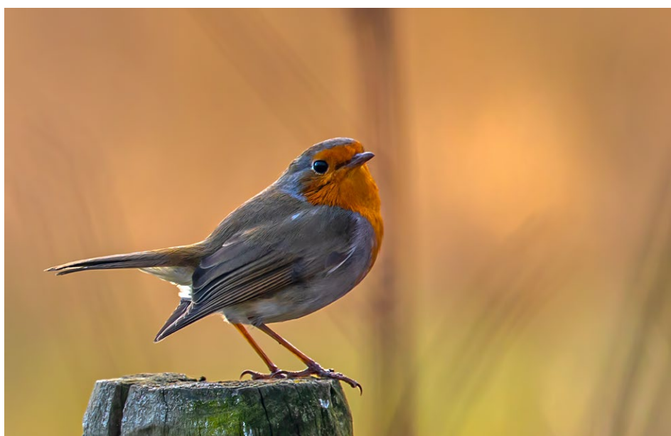
Figure 4 : rouge-gorge.