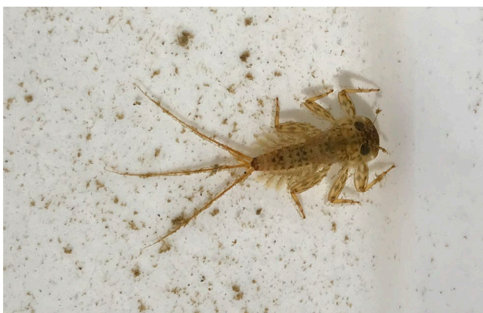
Figure 7 : larve d'Éphémère.