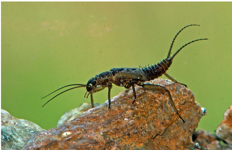
Figure 21 : larve de Perle.