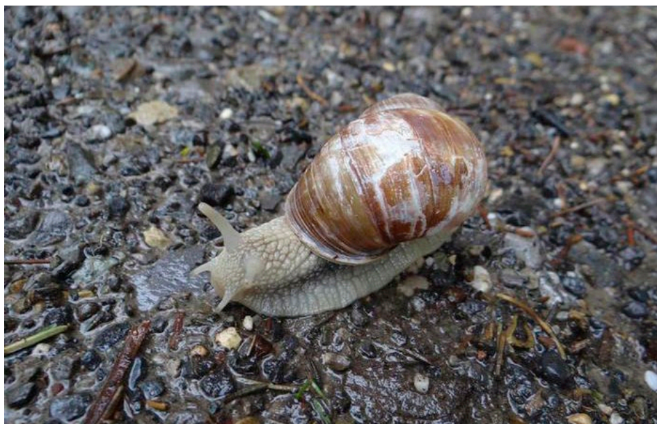
Figure 2 : escargot des vignes.