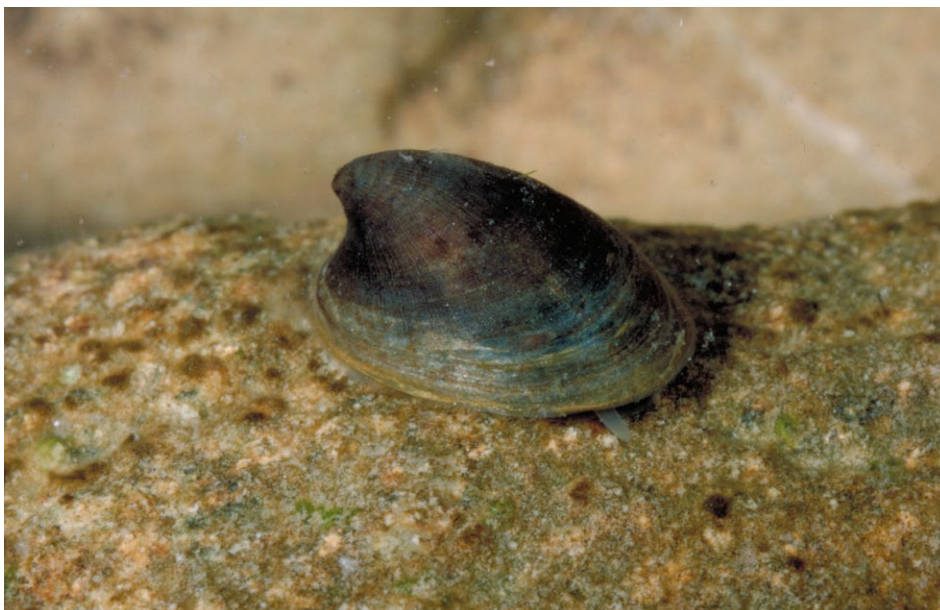
Figure 1 : Ancyle des rivières.