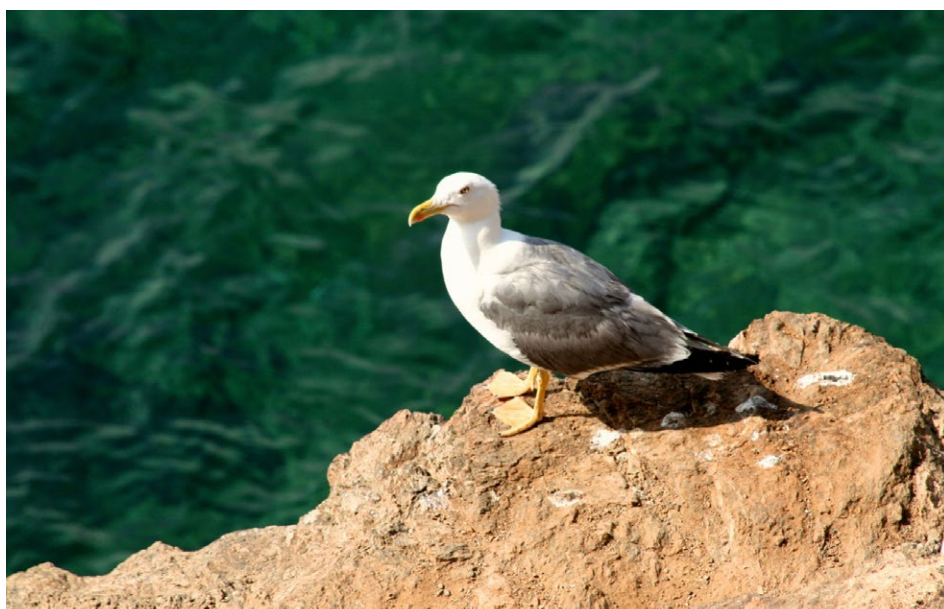
Figure 24 : mouette.