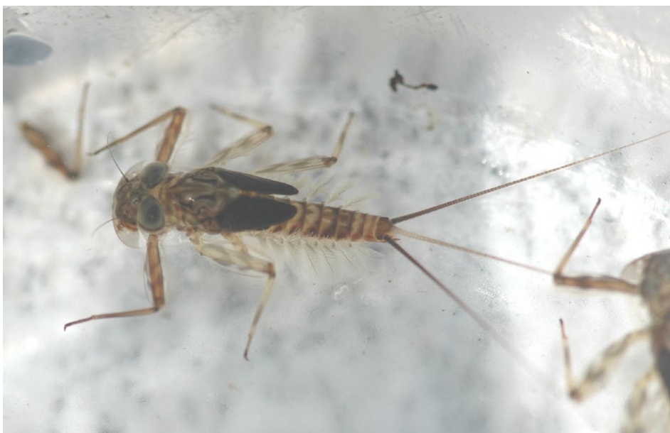
Figure 28 : larve d'Éphémère.