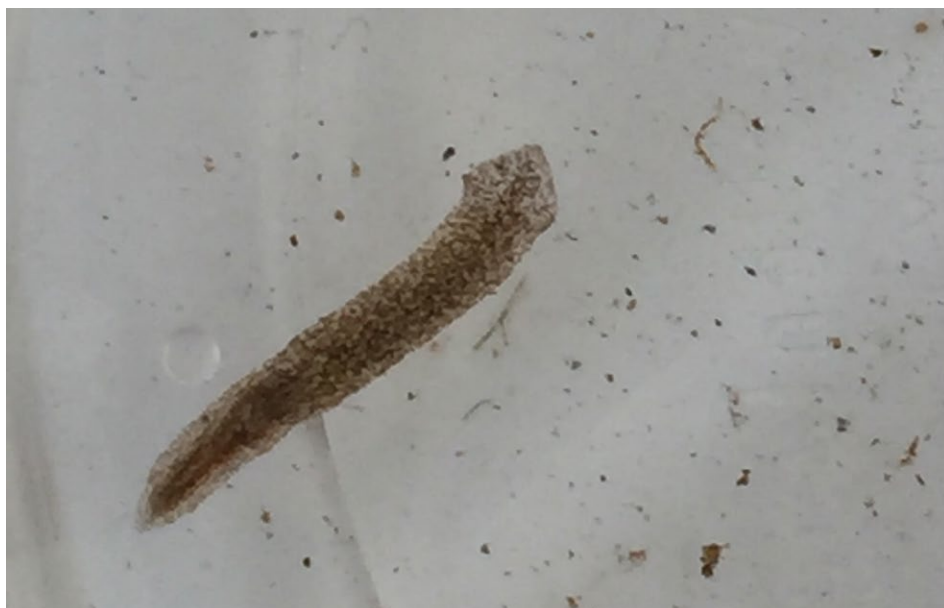
Figure 17 : Planaire gonocéphale.